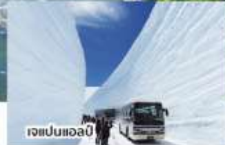
เจแปนแอลป์