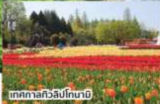
เทศกาลทิวลิปโทนาบี