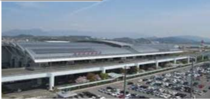
สนามบินฟุกุโอกะ

เวลา 00.50 น. ออกเดินทางสู่ สนามบินฟุกุโอกะ ประเทศญี่ปุ่น โดยสายการบินไทย เที่ยวบินที่