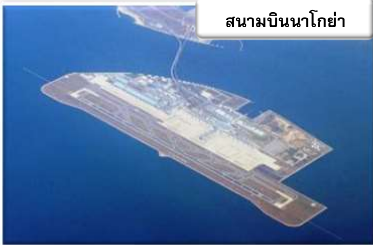
สนามบินนาโกย่า

เวลา 00.05 น. ออกเดินทางสู่ สนามบินนาโกย่า ประเทศญี่ปุ่น โดย สายการบินไทย เที่ยวบินที่ TG 644