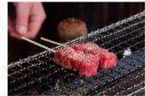
รูปประทานอาหารกลางวัน ณ ภัตตาคาร