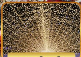
มาบะนะโนะซาโตะ