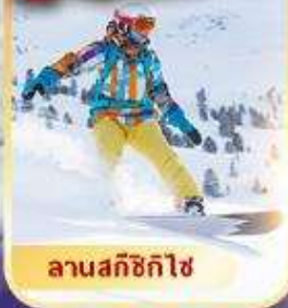
ลานสกีซิกิไซ