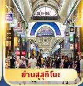
ย่านสุซึกิโนะ