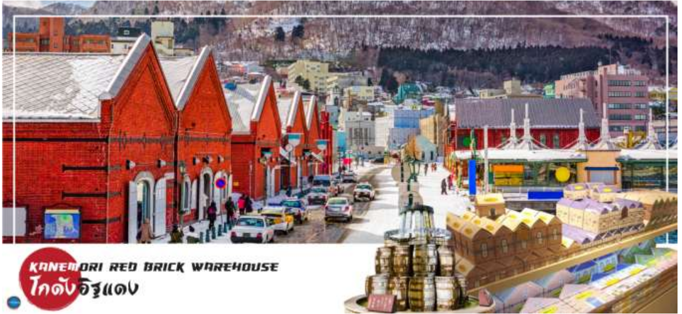
KANEMORI RED BRICK WAREHOUSE โกดังอิฐแดง