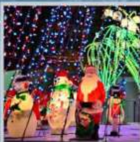
"ODORI GERMAN CHRISTMAS"