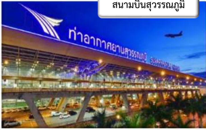
สนามบินสุวรรณภูมิ

เวลา 05.00 น.พร้อมกันที่ สนามบินสุวรรณภูมิ อาคารผู้โดยสารขาออกระหว่างประเทศ เคาน์เตอร์ C สายการบิน ไทยแอร์เวย์ เจ้าหน้าที่คอยให้การต้อนรับดูแลด้านเอกสาร เช็คอิน และสัมภาระในการเดินทาง