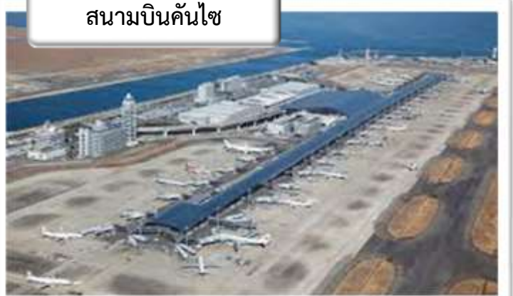
สนามบินคันไซ