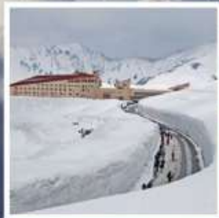
กำแพงหิมะ เจแปนแอลป์