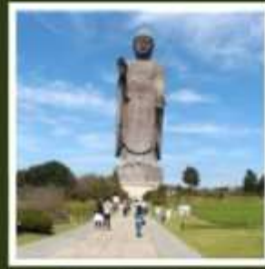
พระพุทธรูปอชิคุโตบุทสึ