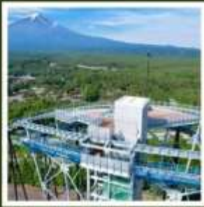
ฟูจิยามะ ทาวเวอร์