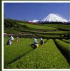
ไร่ชาโอบุจิชะชะบะ