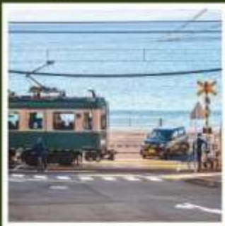
รถไฟเอโบะเด็น