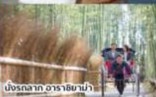
นั่งรถลาก อาราชิยาม่า