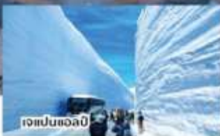
เจแปนแอลป์