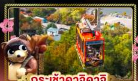
กระเช้าคาจิคาจิ