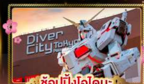
ช้อปปิ้งโอโดบะ