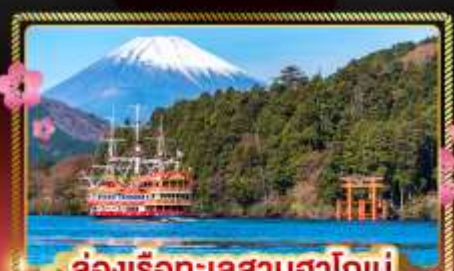
ล่องเรือทะเลสาบฮาโกเน่