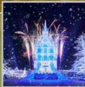
"HUIS TEN BOSCH"