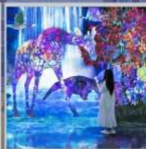
"TEAM LAB FOREST"