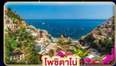
โพซิทานิ