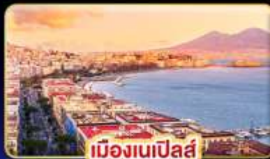
เมืองเนเปิลส์