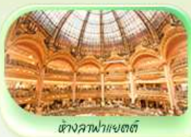
ห้างคาฟฟาแยตต์