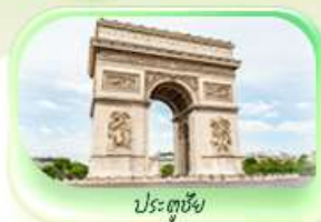
ประตูชัย