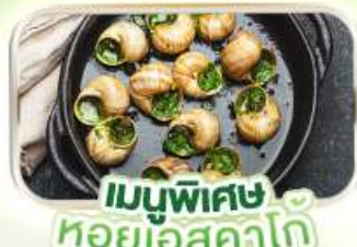
เมนูพิเศษ หอยเอสคาโต้

พิเศษ ล่องเรือแม่น้ำแซนชมเมือง โดย บาโต มูช