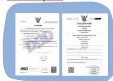
ตัวอย่างหนังสือจดทะเบียนบริษัท และ ใบทะเบียนพาณิชย์