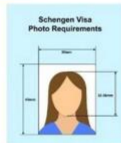
ตัวอย่างรูปถ่าย