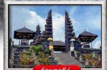
วัดเบซากัท