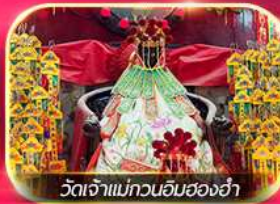
วัดเจ้าแม่กวนอิมฮองอ่า