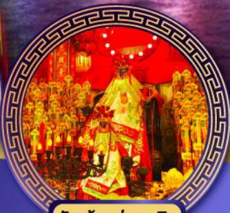
วัดเจ้าแม่กวนอิม ฮองฮำ