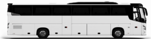
ตัวอย่างรถทัวร์ 1 ชั้น

หากประเภทห้องที่ท่านริเสกมาเต็มจาก ก็เช่น ริเสกห้องพักเป็น TWIN BED หรือ DOUBLE BED ทางบริษัทขอสงวนสิทธิ์ในการปรับประเภทห้องพัก เป็นตามที่โรงแรมมีอยู่ โดยไม่ต้องแจ้งให้ทราบล่วงหน้า