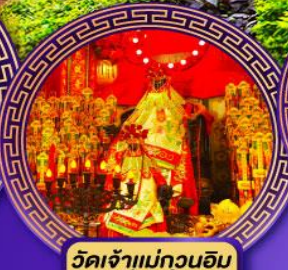
วัดเจ้าแม่กวนอิม ฮ่องฮ่า