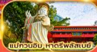
แม่กวนอิม หาดรพีลัสเบย์