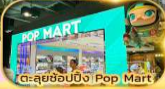
ตะลุยช้อปปิ้ง Pop Mart