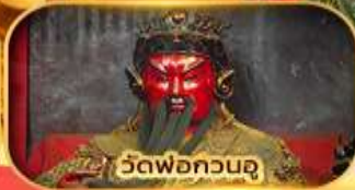
วัดพ่อกวนอู