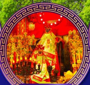
วัดเจ้าแม่กวนอิม ย่งฮ่า