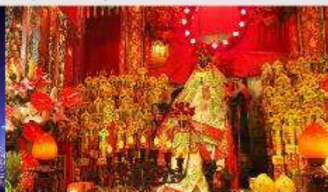
วัดเจ้าแม่กวนอิมของซ่า

*ทางบริษัทฯ ขอสงวนสิทธิ์ในการสลับโปรแกรมทัวร์ตามความเหมาะสมขึ้นอยู่กับสถานการณ์ปัจจุบัน โดยคำนึงถึงผลประโยชน์ของลูกค้าเป็นสำคัญ