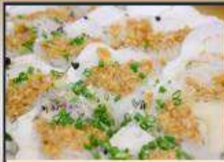
หอยเชลล์อบวุ้นเส้น