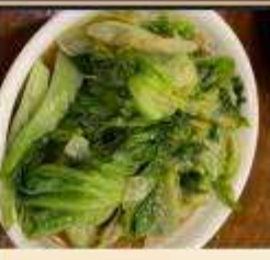
ผัดผักตามฤดูกาล