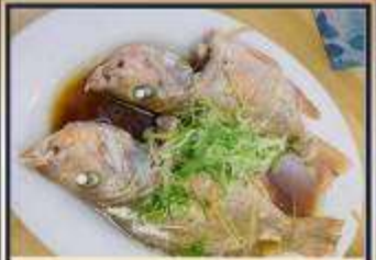
ปลาหนึ่งซีอิ้ว