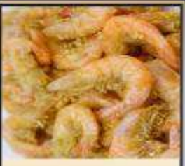
กุ้งทอดกระเทียม