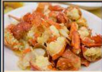
กุ้งมังกรอบซีส