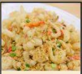
หมึกทอดกระเทียม