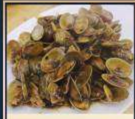
ผัดหอยลาย