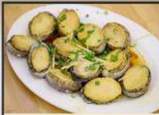
เป่าฮ้อสดหนึ่ง