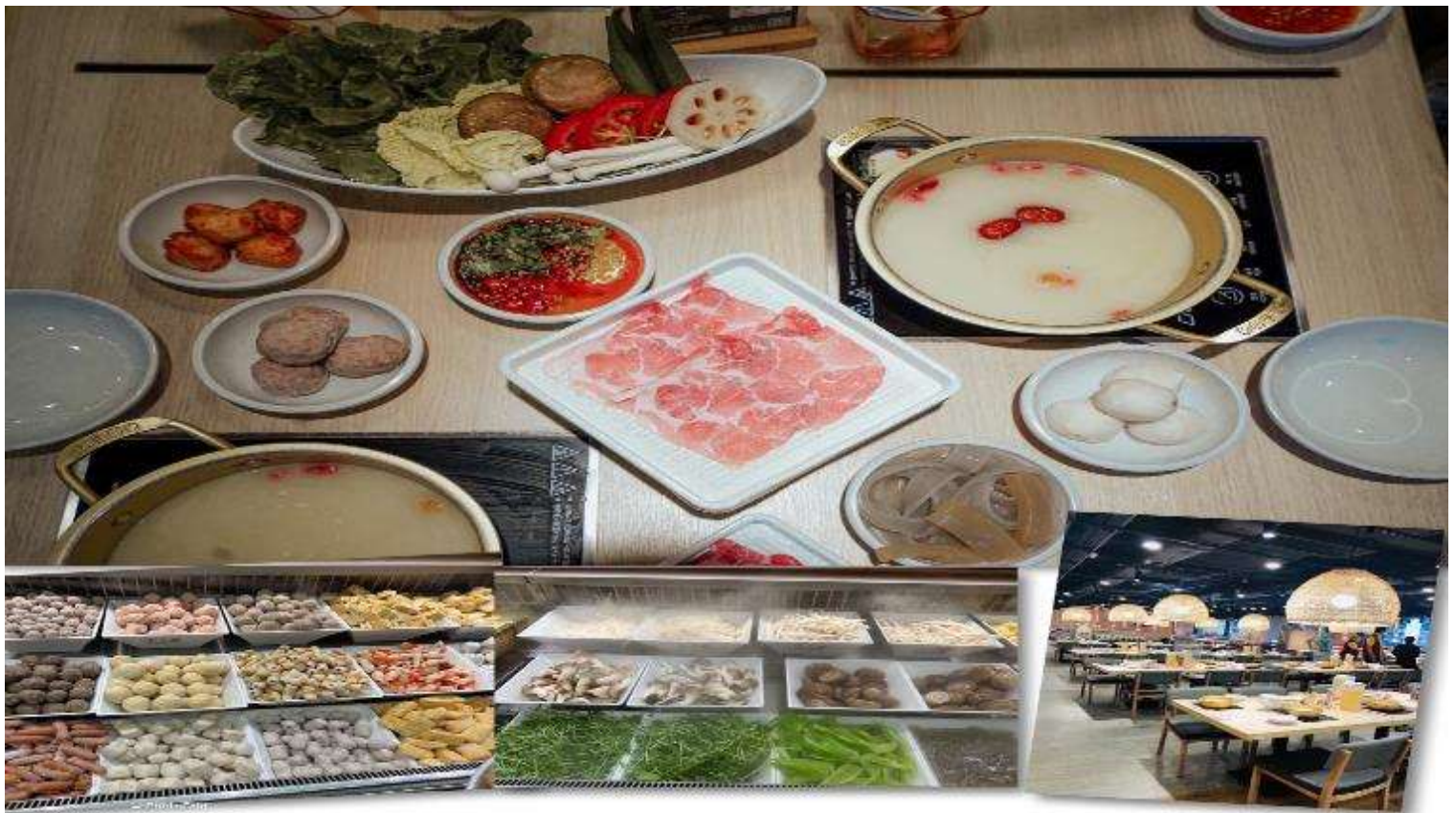
เที่ยง รับประทานอาหารเที่ยง 101 (3) เมนูชาบู