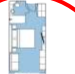
CATEGORY C Balcony Stateroom (57) app. 22 sqm, incl. Balcony