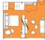
Freydis Suite FS Premium Suite (1) 43 sqm, incl. Balcony