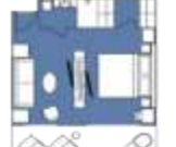
CATEGORY A Junior Suite (4) 40 sqm, incl. Balcony