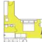
CATEGORY B Balcony Suite (6) app. 32 sqm, incl. Balcony