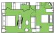
Brynhilde Suite BS Two Bedroom Suite (1) 52 sqm, French Balcony