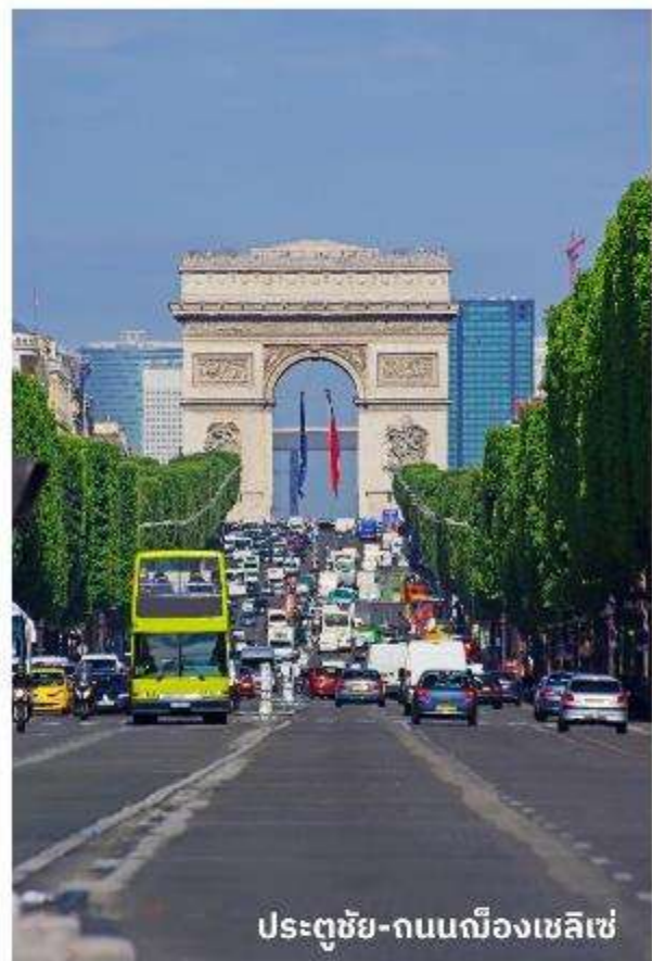
ประตูดัชชี่-ถนนฌ็องเซลิเซ่

บริการอาหารกลางวัน ณ ภัตตาคาร จากนั้นนำท่านเดินทางท่องเที่ยวตามสถานที่ ที่มีชื่อเสียงของกรุงปารีส