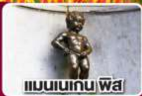
แมนเนเกน พิส