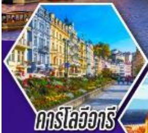
คาร์ลสวูร์ท