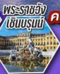
พระราชวัง เซินบรุนน์

เข้าชม ความงดงามและความอลังการ ของพระราชวังเซินบรุนน์