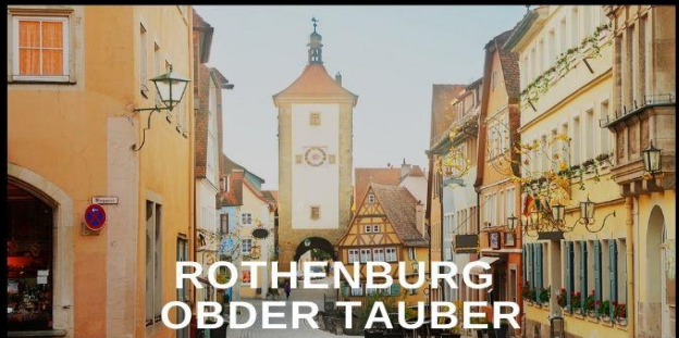
ROTHENBURG OBDER TAUBER