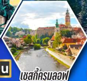
เชสกีครุมลอฟ

การันตีพักโรงแรม Seehotel Gruner Baum ที่หมู่บ้านฮัลสตัดท์