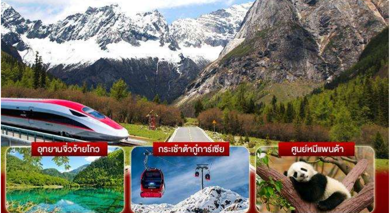
อุทยานจิ่งจ้ายโกว