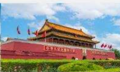
จัตุรัสเทียนอันเหมิน