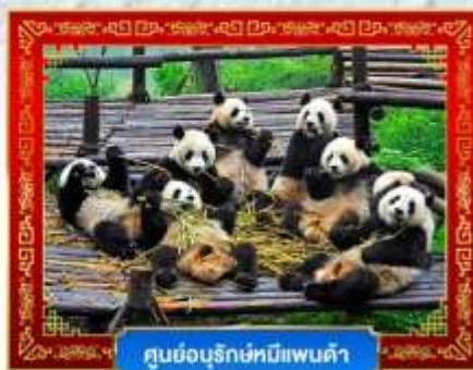
ศูนย์อนุรักษ์หมีแพนด้า