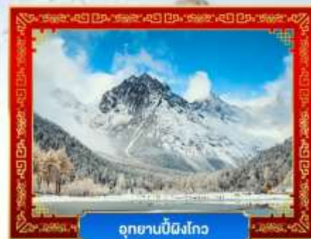
อุทยานปี้ฝิงโกว