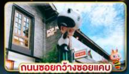
ถนนชอยกว้างชอยแคบ