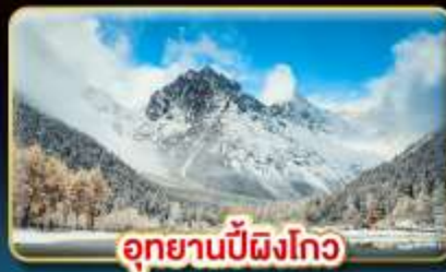
อุทยานปี้ผิงโกว