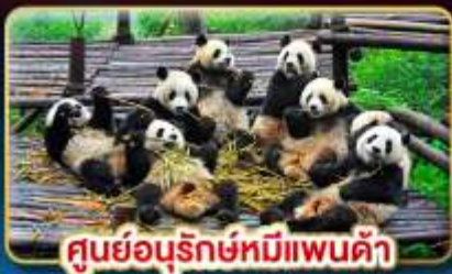
ศูนย์อนุรักษ์หมีแพนด้า

เที่ยว 3 อุทยานสวรรค์ "สัมผัสหิมะขาวโพลนแดนมังกร"