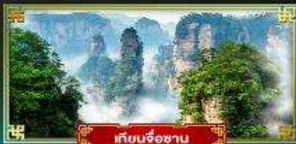
เทียนจ้อซาน