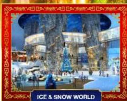
ICE &amp; SNOW WORLD