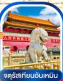
จตุรัสเทียนอันเหมิน