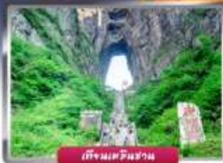
เทียนจินชาน