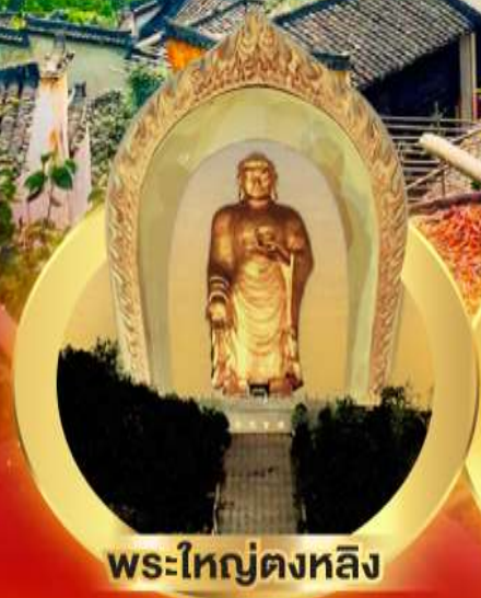
พระใหญ่ตงหลิง