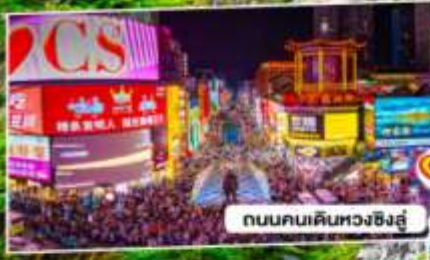
ถนนคนเดินหวงซิงอู่