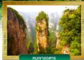
หมู่บ้านหวงตาง