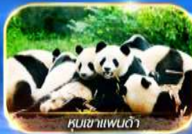
หุบเขาแพนด้า

สัมผัสความงามของธรรมชาติ 2 อุทยาน อุทยานจิ้วจ้ายโกวและอุทยานน้ำแข็งต้ากุกุ นั่งรถไฟความเร็วสูง ชมความน่ารักของน้องหมีที่หุบเขาแพนด้า ซอปปิงที่ไทกุกุหลี่ ดูแพนด้ายักษ์ป็นตึก