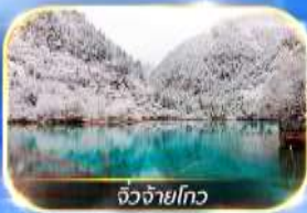
จิ้วจ้ายโกว