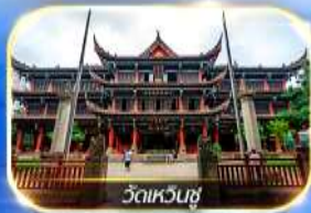
วัดเหวินชู่