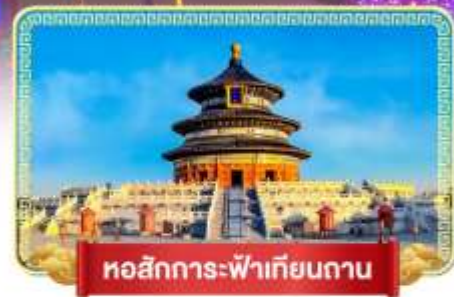
หอสักการะฟ้าเทียนถาน