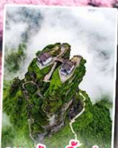
อุทยานกุหลาบพันปี หมู่บ้านแม่วชิเจียง