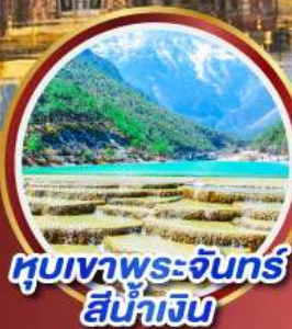
หุบเขาพระจันทร์ สีน้ำเงิน