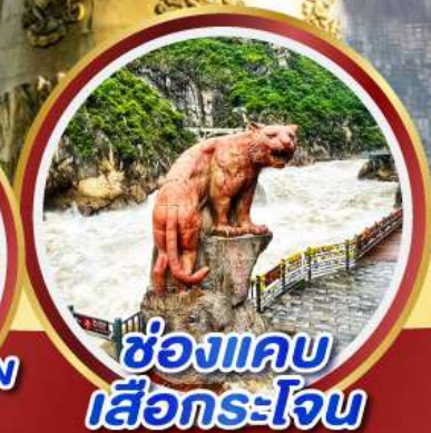
ช่องแคบ เสื่อกระโจน