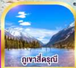
ภูเขาสี่ครุณี