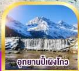
อุทยานปี้เผิงโกว