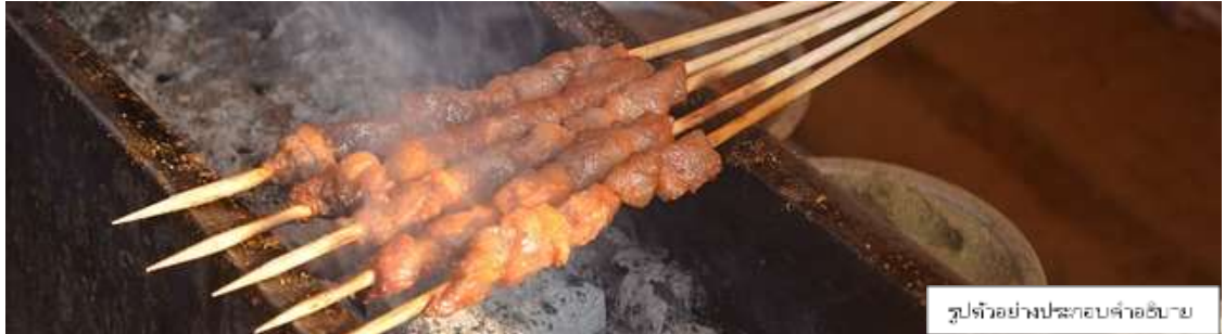
รูปตัวอย่างประกอบคำอธิบาย

เพิ่มพิเศษ เมนูหมูปิ้งย่างหมาล่า ท่านละ 5 ไม้เล็ก